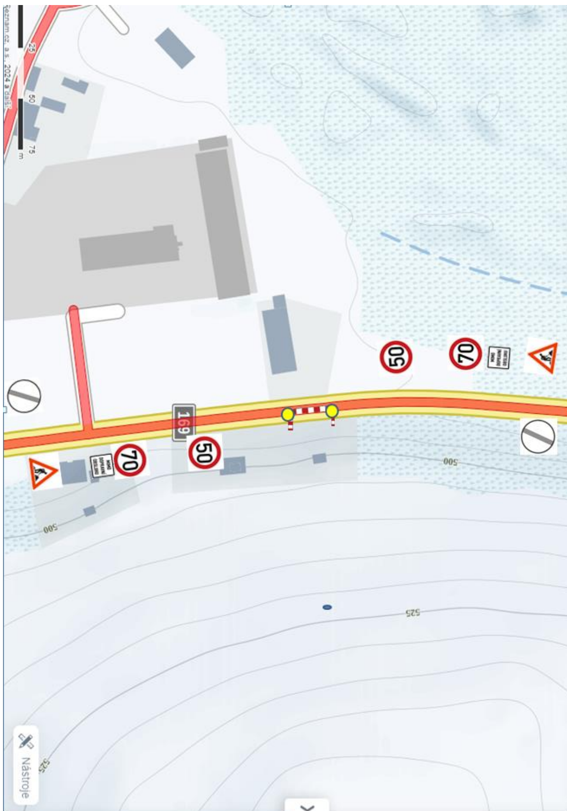
Zvláštní užívání sil. II/169 – umístění stavenišť v termínu červen 2024 – červenec 2024