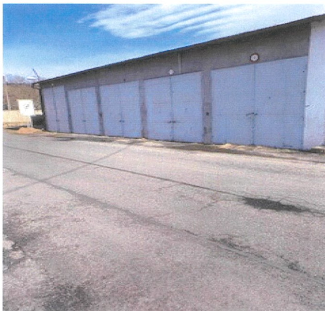
garáže č. 1 – 5 na st.p.č. KN 580/23 v k.ú. Sušice nad Otavou