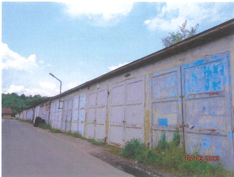
garáže č. 25 a 26 na st.p.č. KN 580/23 v k.ú. Sušice nad Otavou